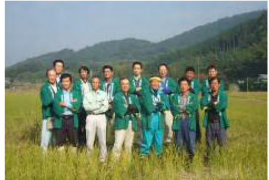
平成22年10月 集合写真 君津市大井戸にて