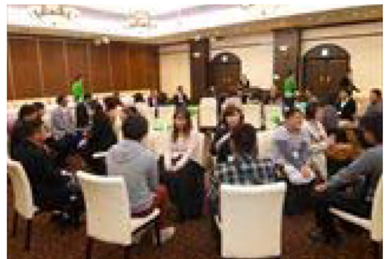
平成26年10月 婚活イベント(ハミルトンホテル上総)