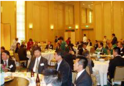
平成22年12月 農業懇談会(オークラアカデミアパークホテル)