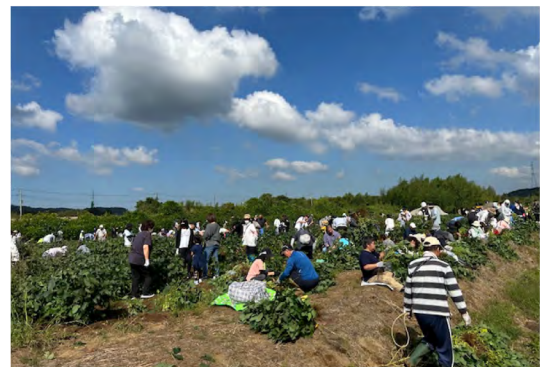
令和6年10月 きみつ枝豆収穫祭(市宿)