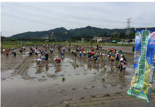
平成30年5月 暁星国際小田植え体験