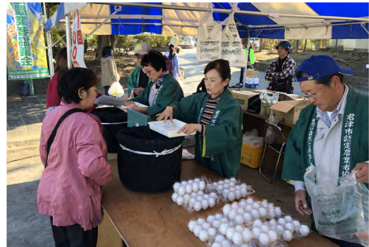
令和元年11月 JAきみつ農業祭り (内みのわ運動公園)