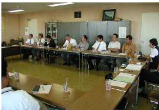
平成14年11月 学校給食検討会