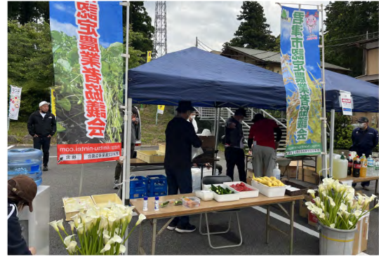
令和5年5月 君津ウルトラマラソン農産物提供