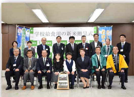
給食用新米贈呈式