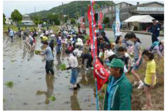
平成21年5月 一般 農業体験「米づくり」-田植え-(末吉)