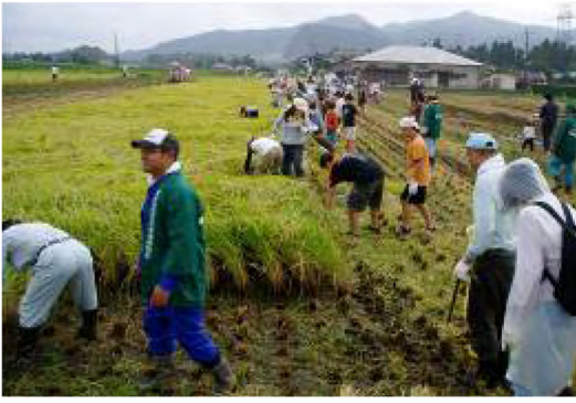
平成20年9月 小糸小学校 農業体験「米づくり」-稲刈り-(糸川)