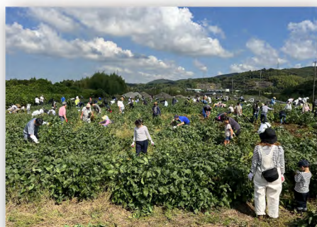
きみつ枝豆収穫祭