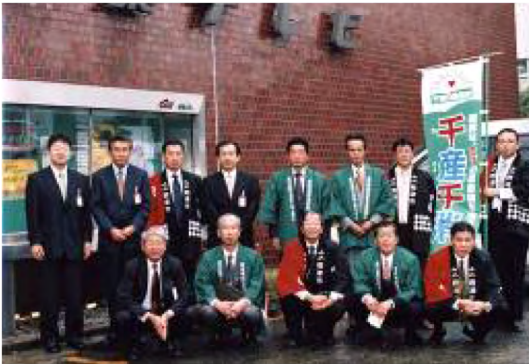
平成15年11月 (千葉テレビ本社) 君津フレッシュBOXキャラバン