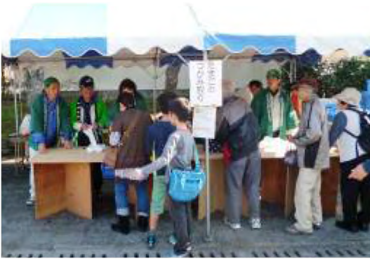
平成26年11月 農業まつり 卵のつかみ取り(内みのわ運動公園)