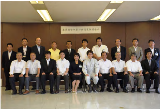
令和元年8月 農業経営改善計画認定証授与式