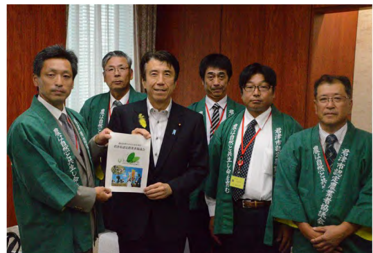
平成30年6月 斉藤農林水産大臣へ訪問