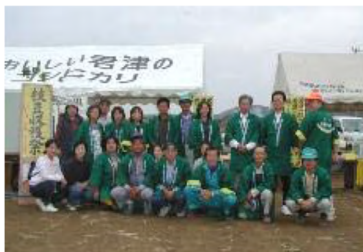
平成12年10月 枝豆収穫祭(市宿)