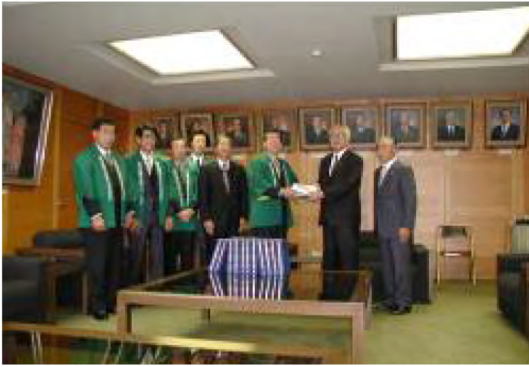
平成14年12月 食品加工総覧寄贈