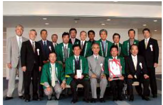
平成18年7月22日 (君津市文化ホール) クローバー賞(新日鐵君津社会貢献賞)受賞