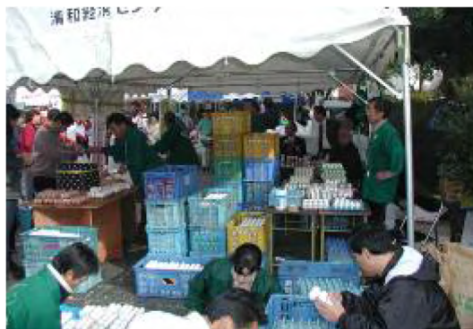
平成13年11月 JAきみつ農業まつり (内みのわ運動公園)