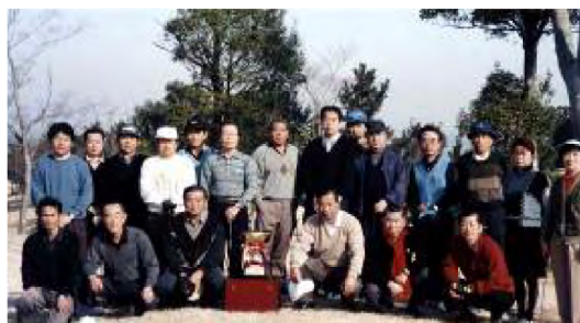
平成9年2月 第2回親睦ゴルフ大会 (君津ゴルフ倶楽部)