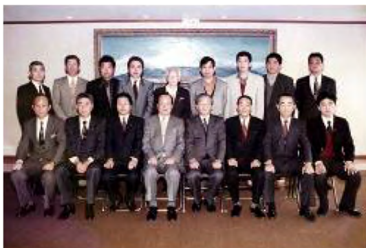
平成7年3月 認定農業者認定授与式 (初回認定農業者)