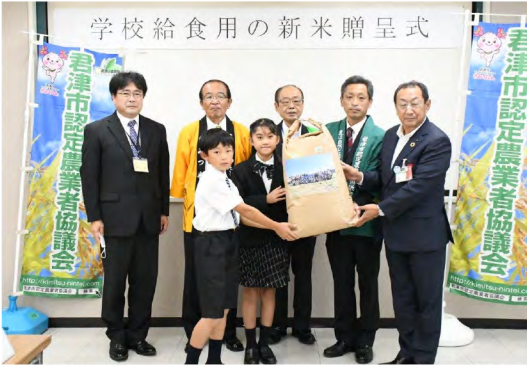
令和4年10月 給食用新米贈呈式