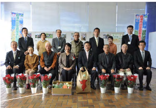
令和元年12月 フォトコンテスト表彰式