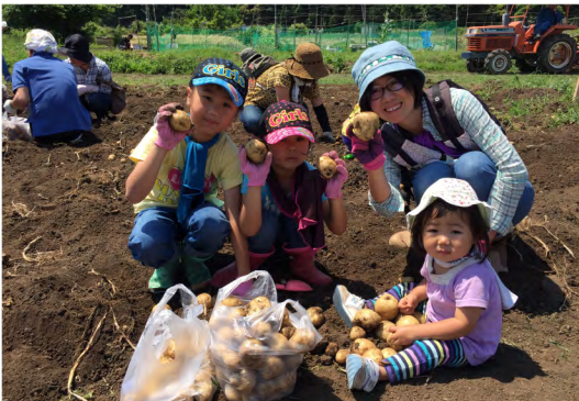
平成29年6月 きみつジャガイモ収穫祭(上湯江)