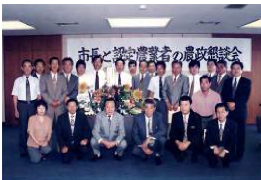
平成9年7月 市長と農政懇談会