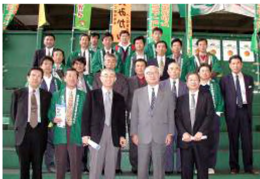
平成13年11月 市長と大田市場研修