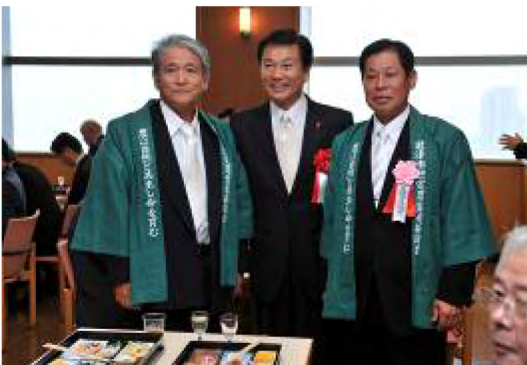
平成23年11月 文化の日千葉県農林水産功労者表彰受賞(千葉県庁)