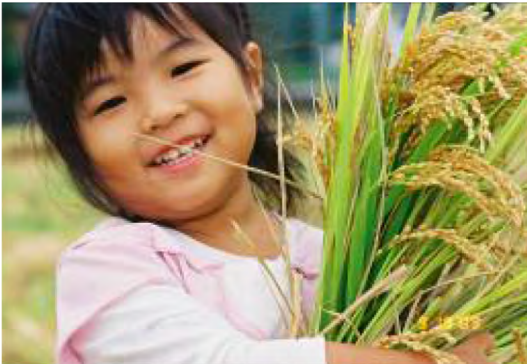
平成21年9月 一般 農業体験「米づくり」-稲刈り-(末吉) フォトコンテスト(最優秀賞受賞作品)