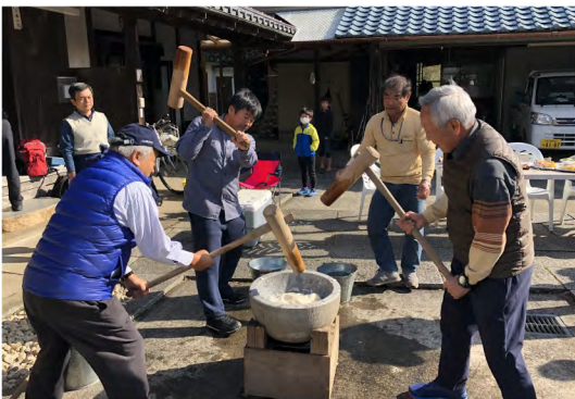
令和元年12月 おこめのわ もちつき大会