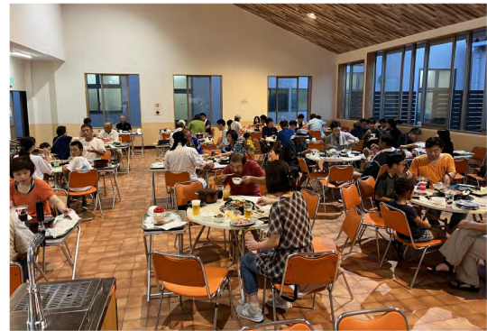
令和5年8月 納涼祭(マザー牧場)