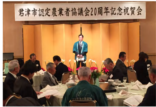
平成26年12月 20周年記念祝賀会 (オークラアカデミアパークホテル)