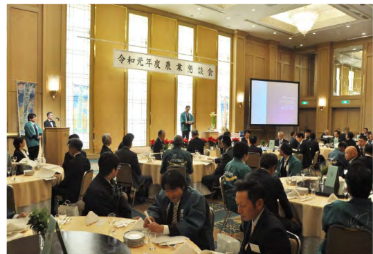
令和元年12月 農業懇談会 (オークラアカデミアパークホテル)