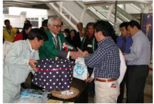
平成15年10月 東京湾アクアライン海ほたる 市長とともに君津市農産物PR