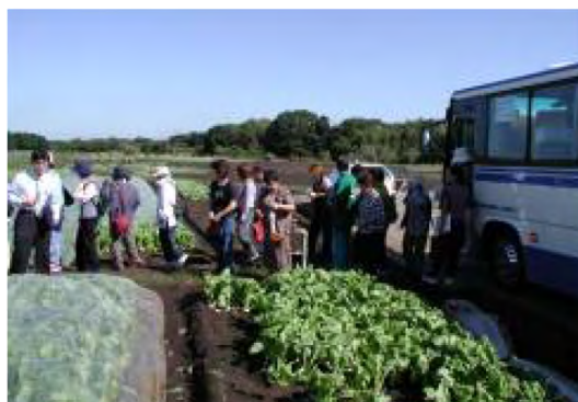
平成14年10月 農業体験バスツアー(三舟台)