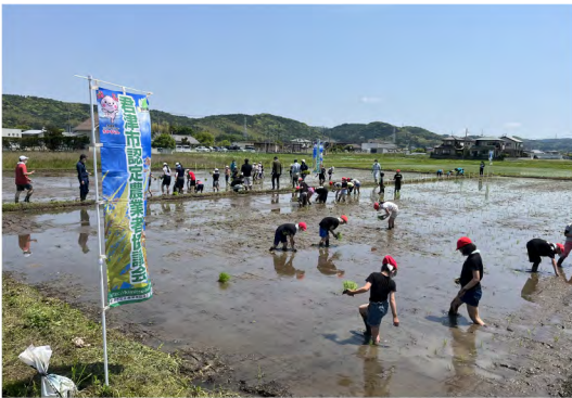
令和5年5月 小糸小田植え体験(中島)