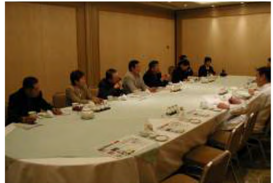
平成16年3月 オークラアカデミアパークホテルとの意見交換