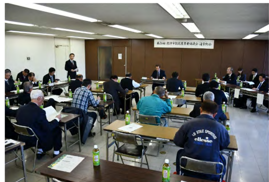
令和2年1月 第26回通常総会