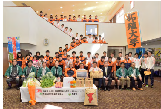
平成29年3月 拓大陸上競技部への農産物贈呈