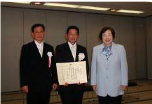
平成18年11月9日(千葉県庁) 千葉県農業奨励賞受賞