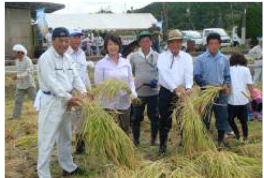
平成23年9月 農業体験「米づくり」-稲刈り-(末吉)