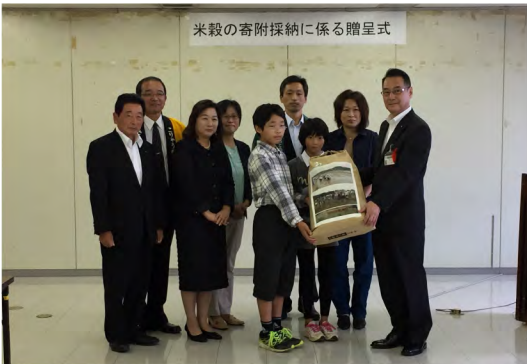
平成28年10月 給食用新米贈呈式