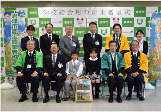
令和3年10月 給食用新米贈呈式