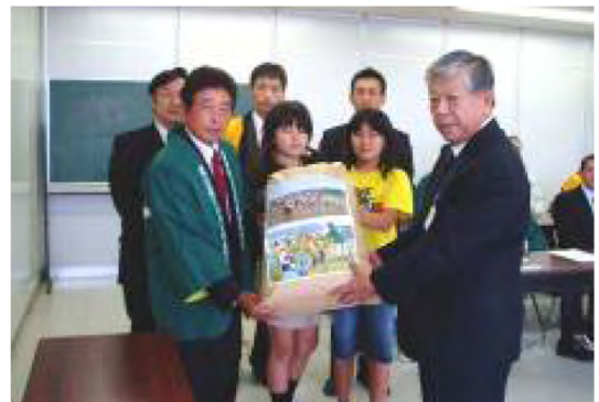
平成19年10月 給食用新米贈呈式