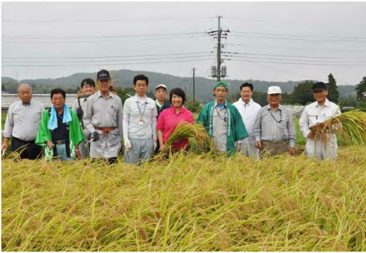
平成30年9月 農業体験「米づくり」 -稲刈り-(糸川)