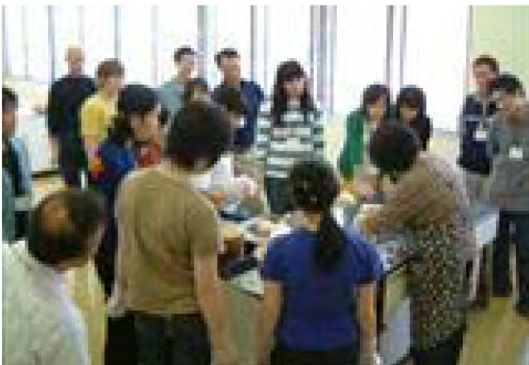
平成17年6月 グリーンハート号 (農村環境改善センター)