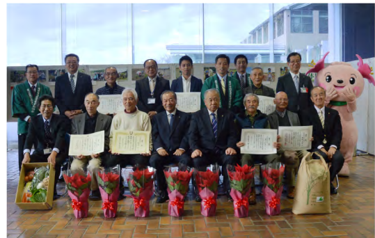
平成29年12月 フォトコンテスト表彰式(市役所)